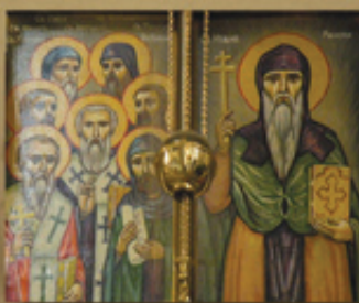
Св. Седмочисленици и св. Иван Рилски. Олтарна икона от църквата „Св. Кирил и Методий“ в Пловдив. Зографи Георги и Никола Данчови, XIX в.