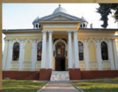
Църквата „Св. Кирил и Методий“ в Пловдив, построена през 1884 г.