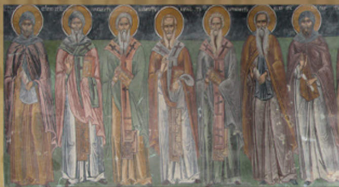
Св. Седмочисленици. Стенописно изображение от църквата на Слимичкият манастир „Св. Богородица“, Прилеп, 1612 г.