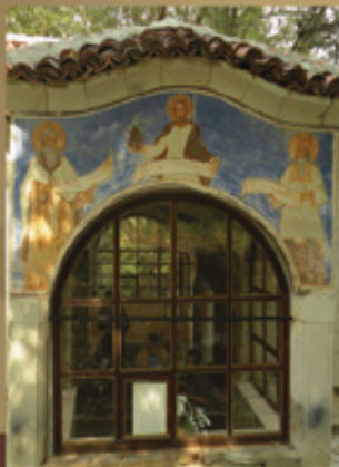
Аязмото към Араповския манастир „Св. Неделя“, близо до Асеновград, XIX в.