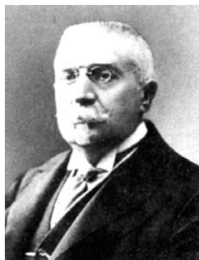
акад. Иван Ивстр. Гешов

Засилената научна и международна дейност създава предпоставки за преобразуването на БКД в Българска академия на науките. С документи отново се подчертава ролята на Ив. Ев. Гешов за този изключителен акт през 1911 г. Изложбата показва и протокола на Общото събрание от 20 февруари 1911 г. с решение за преименуването на Дружеството в Академия, поздравителните телеграми от Вилнюс, С. Петербург и Белград и първия Закон за БАН /1912 г./.