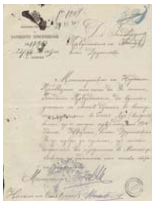
Покана за участие на БКД в световното изложение в Сент Луи. февр. 1903 г.

музей, Берлинската кралска академия, Южнославянската академия на науките и Славянския благотворителен комитет.