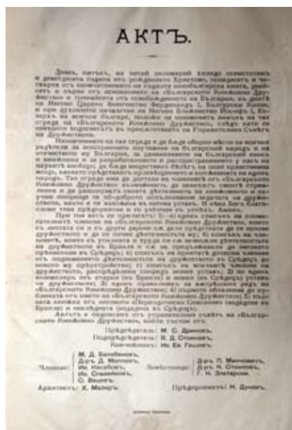
Акт за полагане основния камък на сградата на БКД. 5 октомври 1890 г., София