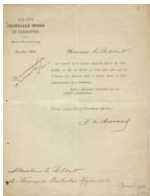
Участие на БКД в 50 г. юбилей на Императорското географско дружество. дек. 1890 г.