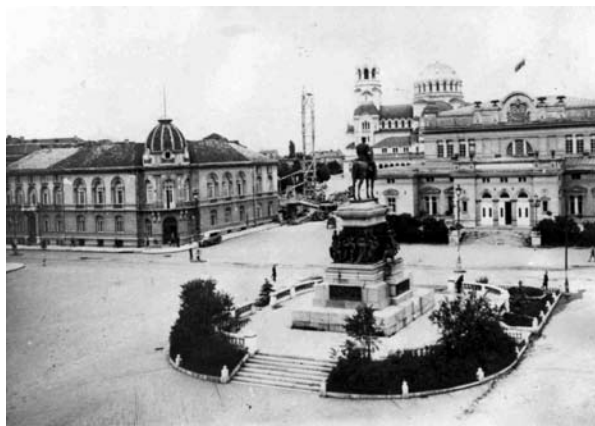
Сградата на БАН, разрушена от бомбардировките, 1944 г.

През следващите години Академията се развива като национален научен център, в който израстват учени с голяма професионална квалификация и международно признание. В започналото динамично преустройство БАН защитава своите позиции на автономна институция и се стреми да умножава духовните и материалните ценности на българското общество — мисия, която съвпада със съкровените цели и стремежи на първостроителите на БКД преди 140 години.