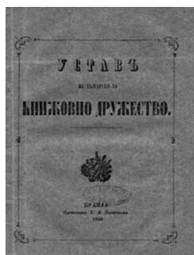
Устав на БКД, Браила 1869 г.