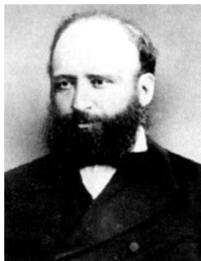
проф. М. Дринов

По повод 140-годишнината от създаването на Българската академия на науките Научният архив организира традиционно отбелязване на юбилея с документална изложба в Народния театър “Иван Вазов” под надслов “Странички от историята”. Представени са личности и събития, свързани с важни моменти от дейността на Българското книжовно дружество и Българската академия на науките чрез оригинално подбрани документи от богатото академично архивно наследство.