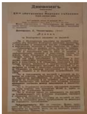
Дневник на XV ОНС. Закон за БАН.