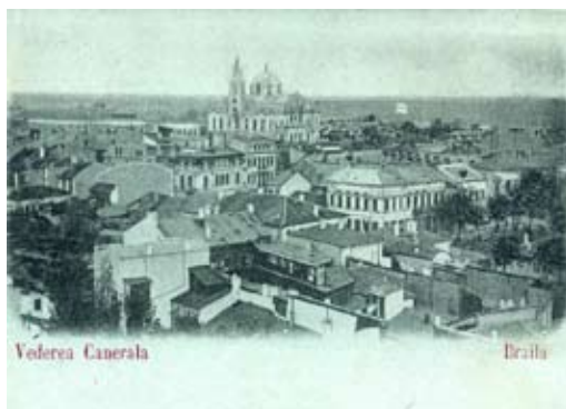
Браила в края на 19 век