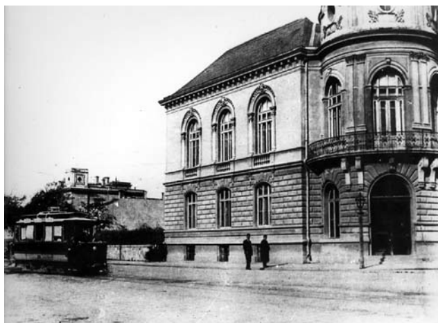
Сградата на БАН в началото на XX в.