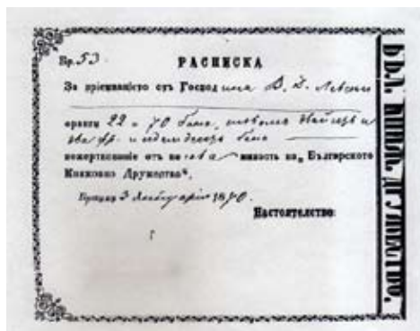
Първи дарители - Разписка на В. Левски

Строежът на сградата на БАН може да се проследи в документите за собственост на мястото, за нейното изграждане и разширение през годините. Илюстративният материал по темата показва, че това е един от най-добрите архитектурни ансамбли в столицата. Важни са протоколът на общината и уведомителното писмо на кмета Н. Сукнаров (май-юни 1883 г.) за подаряване мястото за сградата на БКД, актът за полагане на основния камък през 1890 г. и крепостният акт за собственост от 1892 г. Атрактивни са плановете и скиците на сградата преди (1890 г.) и след нейното разширение (1926 г.). Показан