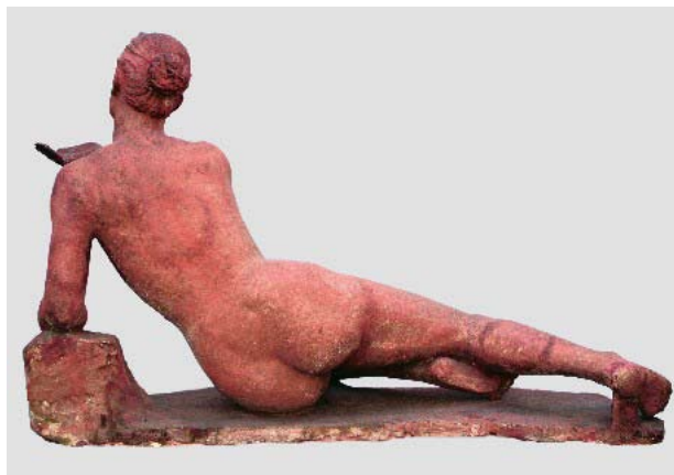
Голо тяло (Край извора), 1968 г., теракота, 87x140x70, подпис и дата на основата, отпред, вдясно: В. Емануилова 1968 IX, СГХГ, дарение от Васка Емануилова, инв. № 58, юбилейна изложба 1976 г.