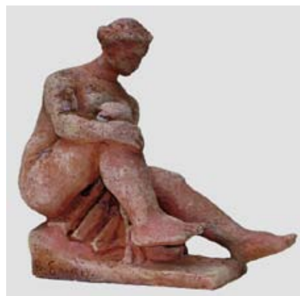
Миеща се, 1965 г., теракота, 20x12x20, подпис на основата, вдясно: В. ЕМАН, СГХГ, дарение от Васка Емануилова, инв. № 69