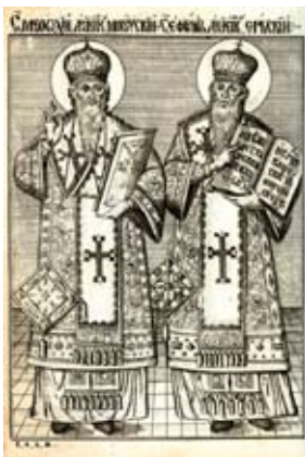
Св. Методий, архиепископ Моравский, и Св. Ефрем, архиепископ сербский

Христофор Жефарович осъществява книжовната си дейност в тежка историческа ситуация. В годините на османското владичество част от просветените българи — книжовници, зографи, търговци като например Партений Павлович, Йован Раич, Петър Берон, Иван Селямински, Христофор Жефарович и др. напускат пределите на поробеното отечество, работят и творят и в други балкански страни. Тогава чувството за национална принадлежност не е база за противопоставяне и идеите на илиризма са подходяща платформа за изразяване на национални и патриотични чувства.