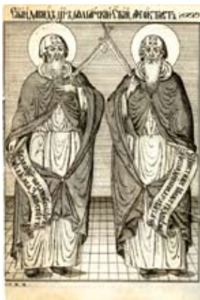
Св. Давид, цар българский, и Св. Теоктист