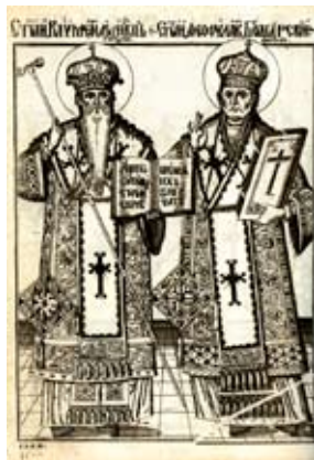
Св. Климент, архиепископ Охридски, и Св. Теофилакт, български епископ

Основен източник за написване на “Стематографията” е едноименното съчинение на хърватина Павел Ритер-Витезович на латински език — “Стематография... илирикум”, а също и “История” на Мавро Орбини, от чийто руски превод се е ползвал и Паисий Хилендарски за написване на своята “История славяно-болгарская”.