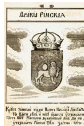
Герб “Тракия Рим- ская”