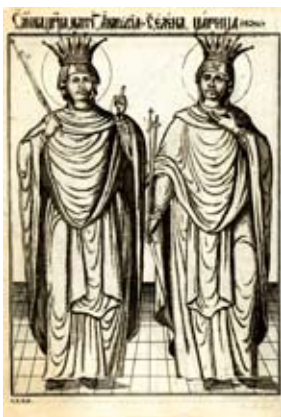
Св. Анна царица, наречена Анастасия, и Св. Елена царица