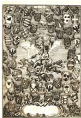
Изображение на Стефан Силни, заобиколено от 56 герба, представени в “Стематографията”