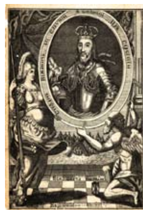
Изображение на Стефан Неманич с Минерва и Хронос

също както на България, но с обърнати цветове — лъвът е червен на златно поле без корона. В герба на Дардания за основен символ е използван червен лъв на сребърен фон, обърнат наляво с раздвоена опашка и копие в предните лапи. Липсата на царски корони при лъвовете от гербовете на Македония, Тракия и Дардания и изобразяването само на княжески корони за тези области сочат, че Жефарович иска да подчертае техния статут на отделни области, обединени и подвластни на едно царство — България.