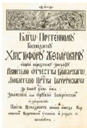
Стихотворна възхвала на Христофор Жефарович от Павел Ненадович