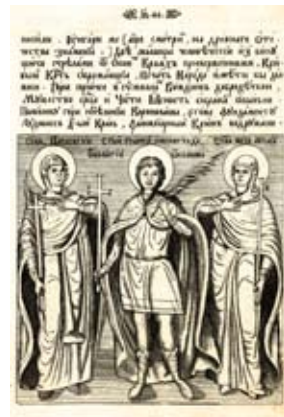
Изображение на св. Параскева, Св. Георги Софийски Нови и Св. Майка на ангелите