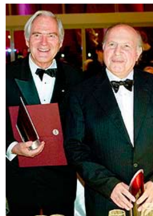
Имре Кертес (вдясно) - Лауреат на Нобелова награда