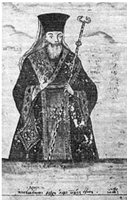
Автопортрет на Софроний Врачански (2. изд., Букурещ, 1865 г.)