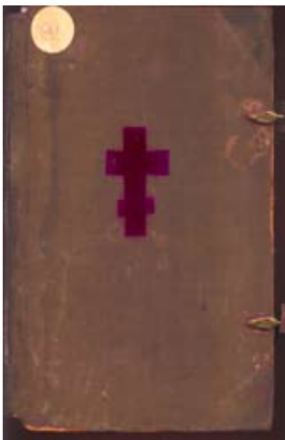
Корица на първото издание

“Кириакодромион, сиреч Неделник поучение” съдържа 272 страници, от които 265 са номерирани, първите шест и последната страница са неномерирани. Замисълът на книгата се посочва от самия автор — да служи на църковната дейност на българските свещеници и за домашен прочит на хората — “...На всех неделях в православных церквах прочитаемая в всего лета с толкованием и с нравоучение и на великих господских праздниках и на святых празнуемых сказание душеполезная”. В съдържателно отношение включва: оглавление т. е. съдържание, предисловие, 60 поучения, 33 слова, 1 сказание и 2 наставления — при кръщения и при новобрачни, подредени в съответствие с последователността на църковните празници в една календарна година, и послесловие на Софроний и печатарите.