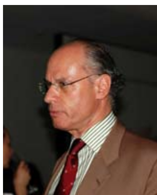
Негово превъзходителство Стефано Бенацо, посланик на Италия в България

Н а 8 септември в Археологическия музей беше открита изложбата “Европа в образи” под патронажа на Посолството на Италия, Столичната община и Асоциацията за развитие на София.