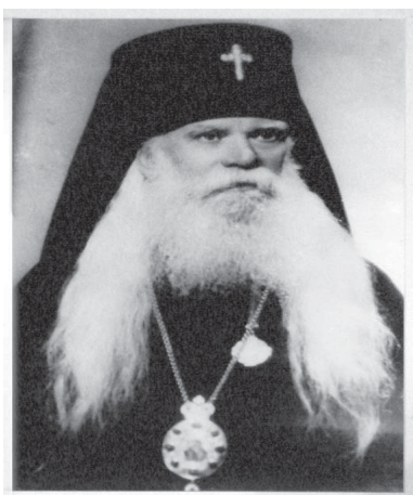
Архиепископ Серафим (Соболев)