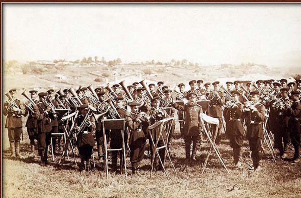
Гвардейският духов оркестър свири пред дефилиращите части след превземането на Плевен, 2 / 14 декември 1877 г.

През 1903 г. по случай 25 г. от Освобождението кметът на столицата Чернев изпраща благодарствена телеграма от името на столичани и „всенародното тържество“ до княз Фердинанд и граф Игнатиев. „Вечно признателна България“ слави руския император Александър II като Освободител, а Всеросийският император Николай II като Покровител. През същата година в Плевен къщата, в която е живял Александър II, става музей „Александър II“, в Бяла се организира къща-музей „Александър III“, в с. Пордим — къща-музей „Николай Николаевич“ и в с. Горна Студена — „Музей на Освободителната война“.