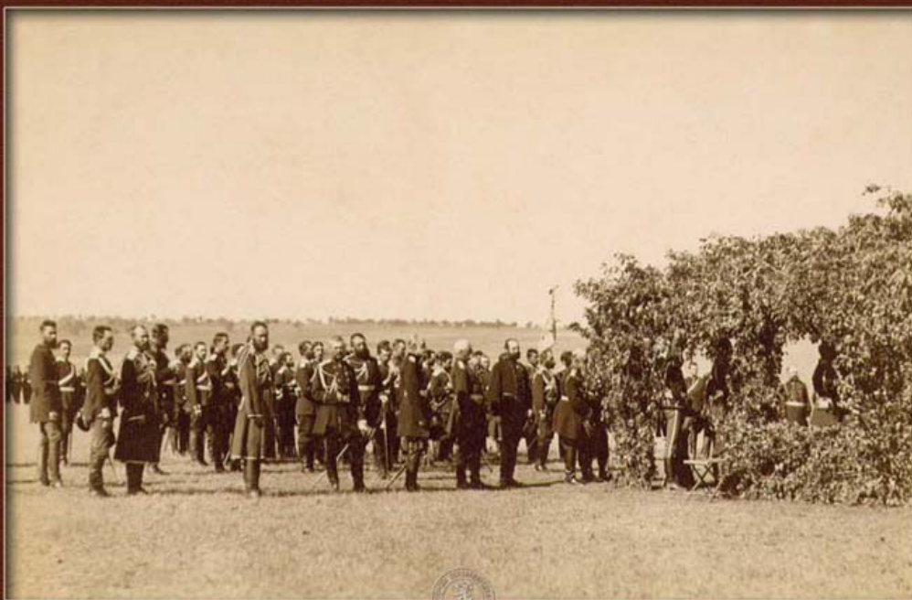
Тържествен молебен на шосето за Гривица в присъствието на император Александър II, с участието на войските превзели Плевен, 29 ноември / 11 декември 1877 г.

ден, който напоминюва за великото благодеяние, направено от Русия на българския народ чрез освобождението му от турско робство, трябваше да се заличи от паметта на българските граждани. Отначало съвсем престана да се празнува, а по-късно, макар да се възстанови пак, обаче празнуването му почна да става с най-голяма скромност, като се отстрани съвършено войската от участие в празнуването. Ние мислим, че е време вече да се разбере, че това пренебрежение на най-големия народен празник трябва да престане”.