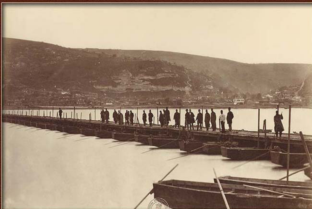
Понтонният мост при Никопол, август 1877 г.

за проявите на националната ни памет по повод Руско-турската война и значението, което българите ѝ отдават. Тези документи говорят за една традиция, поддържана десетилетия, която през различните периоди от историята ни се е проявявала различно в зависимост от политическата конюнктура, отношенията ни с Русия или международната обстановка (революции, войни и т. н.). Но този „велик всенароден празник на Освобождението“ (в „Дневник“ от 19 февруари /3 март/ 1908 г.) винаги се е празнувал като израз на всенародната признателност за извоюваната свобода.