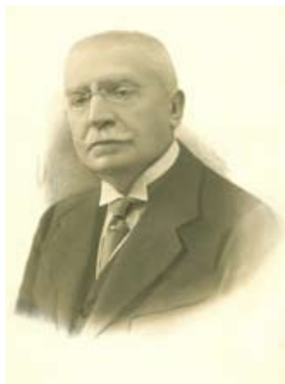
Иван Евстратиев Гешов

На 8 февруари 2009 г. се навършиха 160 години от рождението на големия български държавник и европейски политик Иван Евстратиев Гешов. Неговият жизнен път е толкова богат и плодотворен, че е много трудно да се обхване изцяло и в пълнота. Всяко значително събитие от българската история през последната четвърт на XIX век и първите две десетилетия на XX век може да бъде проследено чрез запазените негови документи и снимки, показани в изложбата, организирана от Научния архив на БАН по повод годишнината.