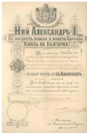
Грамота за награждаване на Ив. Ев. Гешов с орден “Св. Александър”, II степен. 19 февр. 1886 г.

По повод този щедър дарителски акт на Иван Ев. Гешов, на 27 януари 1908 г. в Пловдив е проведено тържествено събрание в негова чест. На това събрание е произнесена реч от Илия С. Бобчев, която е посветена на живота, дейността и заслугите на големия български меценат и филантроп: