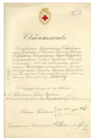
Свидетелство от Руско-то императорско дипломатическо агентство в България за удостояване на Ив. Ев. Гешов с орден “Червен кръст”. 1906 г.

Включването на Гешов в политическия живот на Княжеството е представено на няколко табла — като финансов и търговски министър в правителствата на Константин Стоилов (1894-1897 г.) с негови предизборни и програмни речи, реформи в данъчната