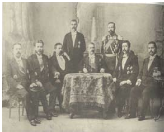
Правителството на Константин Стоилов