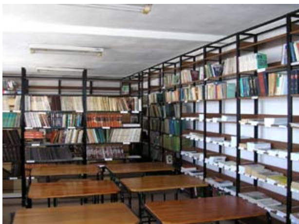
Читалнята на Библиотеката в Института за литература