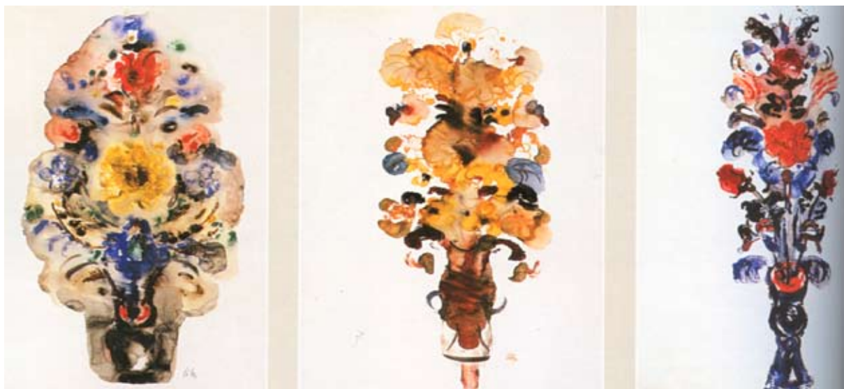
Цветя, 80-те г. на XXв