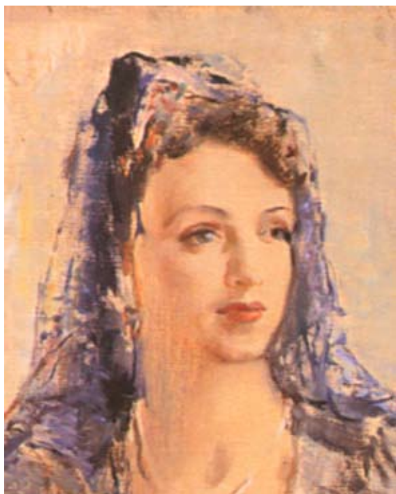
Портрет на млада жена, 1943 г. (фрагмент)