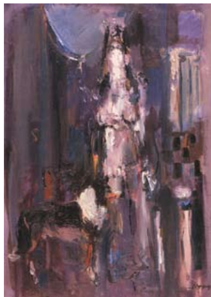
Спомен, края на 70-те години на XX в.

Не само в своите автопортрети Дечко Узунов създава ярки и запомнящи се образи. През всичките творчески десетилетия той ще превръща материалното в художествено видение. По натура или без натура, по памет или въображение творбите му ще запазват силата и първоначалния характер на сякаш създадени за един миг. Ще рисува до края на своя живот. Навършил 85 години, творческата му енергия още не е изчерпана. Все едно какво ще създава — портрет, фигурална композиция, натюрморт, пейзажи, алафранги, асоциации за портрети, абстрактни композиции и др., той ще го върши с майсторска ръка. Ако има някаква разлика между младите и късните му години, то тя не е в отслабването на силите, а в това, че след като е изпитал силата на удоволствието от вродената си дарба в изкуството, неговите форми, багри и ритъм, той предпочита да се отправи към по-прости и по-мъчни неща. Кръгът на това изкуство сякаш постепенно се затваря. Пейзажите му се отдалечават, стават недостижими. Голите тела постепенно се обръщат с гръб към