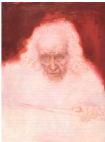
Автопортрет, 1983 г.