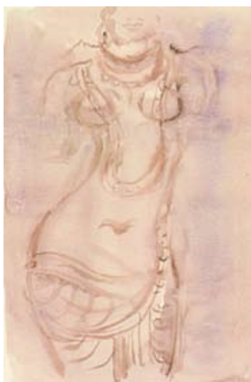
Божество (Индия) 1980/81 г.

нас, човешките образи са като видения, за да превърне накрая света в космически багри и светлини. Виденията за живота — монументално или деликатно нежно, е все така интересно, красиво, феерично за художника, дори когато е станало драматично. Обрисувайки света, Дечко Узунов ни оставя в напрежение, познавайки изкуството, да приключи действието в своите творби сякаш преди спускането на завесата, преди края на спектакъла, без да е разказал всичко. Остава ни сами с нашите съмнения и мисли за създаденото от него изкуство”.