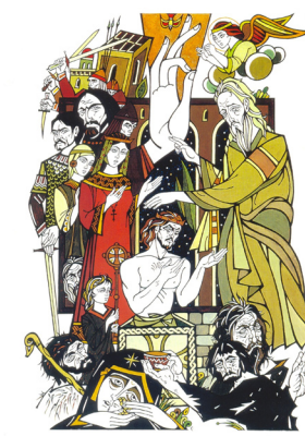
ПАИСИЙ ХИЛЕНДАРСКИ „Славянобългарска история“ През робство. Илюстрация. Топер