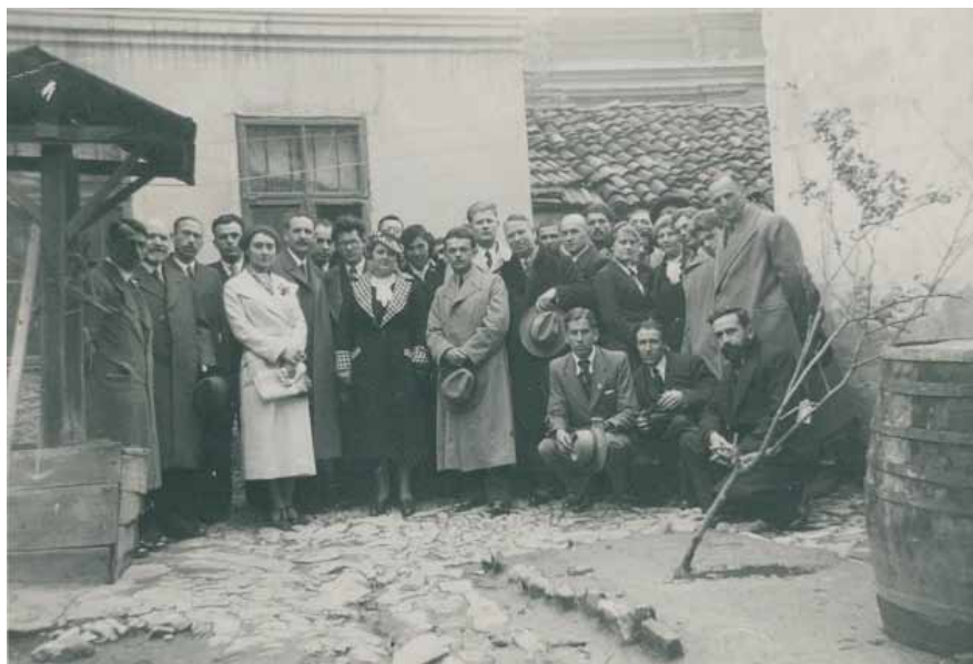
Ячо Хлебаров след конгреса на провинциалните писатели, Плевен, април 1937 г.