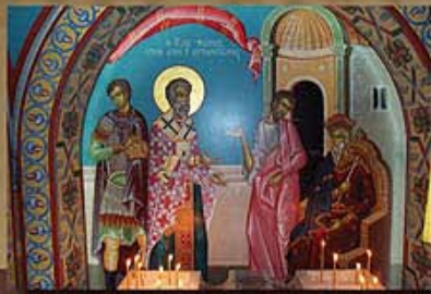
Patriarch Photios mit dem byzantinischen Kaiser Michael III. Wandmalerei in der Hl. Photios Kapelle in der griechischen orthodoxen Hl. Dreifaltigkeit-Kirche (St. Augustin, Florida, USA), einer der ältesten Städte der Neuen Welt, 1565 gegründet. Die Wandmalerei ist aus dem 20. Jh.

Photios – byzantinischer Staatsmann und Schriftsteller, zwei Mal Patriarch von Konstantinopel (858–867, 877–886), Berater des Kaisers Michael III. und Organisator der Großmährischen Mission.