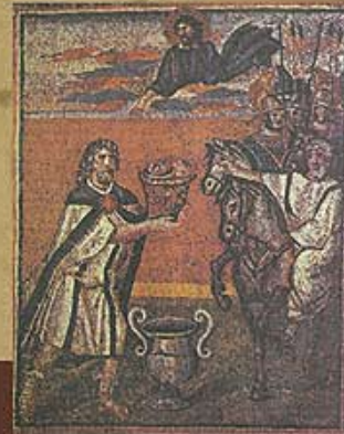
Melchisedech bringt Abraham Gaben dar. Mosaik aus 432–440 in der Kirche Santa Maria Maggiore in Rom, 4. Jh. gebaut.