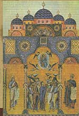
Die Apostelkirche in Konstantinopel, wo sich die Patriarchenschule befand. Miniatur aus einer Handschrift aus dem 12. Jh. Vatikanische Apostolische Bibliothek.