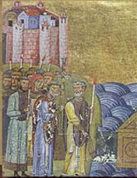
Vermutliche Darstellung der Hl. Kyrill und Method. Miniatur im Menologion des Kaisers Basileios II, Handschrift aus dem 11. Jh. Vatikanische Apostolische Bibliothek.