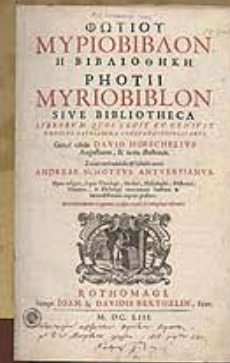
„Myriobiblon“ („Bibliothek“) ist das bekannteste Werk des Patriarchen Photios. Ausgabe aus 1653 (Rouen, Frankreich). Das einzige Werk über Literaturgeschichte, von einem byzantinischen Autor geschrieben und bis heute erhalten.

Photios – byzantinischer Staatsmann und Schriftsteller, zwei Mal Patriarch von Konstantinopel (858–867, 877–886), Berater des Kaisers Michael III. und Organisator der Großmährischen Mission.