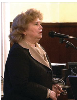
Чл.-кор. Аксиния Джурова