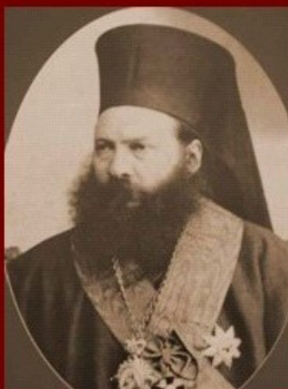
ВАСИЛ ДРУМЕВ (МИТРОПОЛИТ КЛИМЕНТ). ПРЕДСЕДАТЕЛ НА БКД 1898 г.