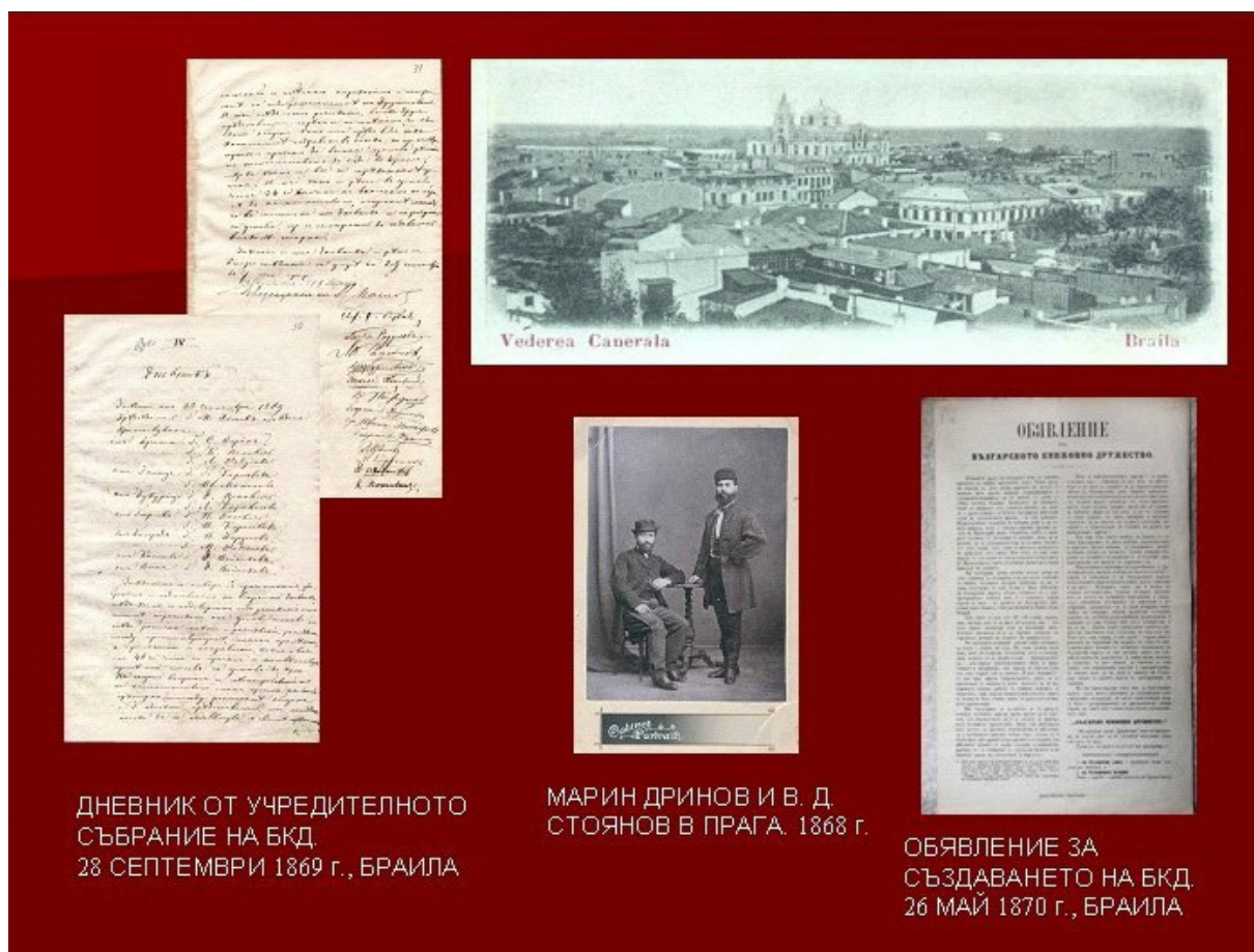
ДНЕВНИК ОТ УЧРЕДИТЕЛНОТО СЪБРАНИЕ НА БКД 28 СЕПТЕМВРИ 1869 г., БРАИЛА