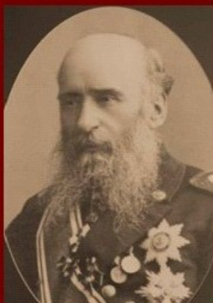
МАРИН СТОЯНОВ ДРИНОВ. ПРЕДСЕДАТЕЛ НА БКД (1869-1882; 1884-1898 г.)

Основатели и първи членове на БКД са българи, завършили образованието си в Европа и Русия. Сред тях са учени, писатели, общественици, революционери, учители, които виждат в знанието сила, освобождаваща духа за културното издигане на нацията и приобщаването ѝ към европейските ценности.